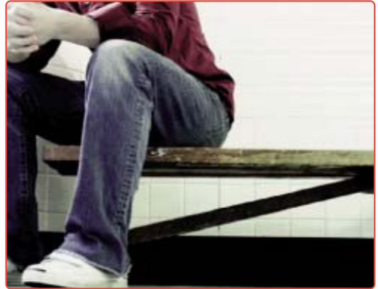
Las sectas utilizan técnicas para anular la voluntad propia

confesión de todo tipo de interioridades. Por ejemplo, usan técnicas de quiebra emocional para que salgan a relucir los problemas personales. Éstos se utilizan para crear dependencia del grupo. -Intentan que el adepto no se informe ni acceda a otras fuentes de conocimiento. Por ejemplo, limitan el acceso a internet. -Se obtiene el patrimonio personal o grandes sumas en concepto de cursos.