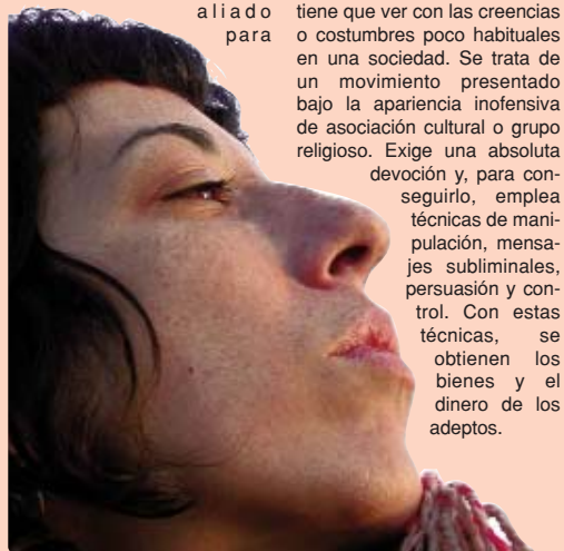
Existe poca información, algo que favorece a estos grupos

Una secta destructiva no tiene que ver con las creencias o costumbres poco habituales en una sociedad. Se trata de un movimiento presentado bajo la apariencia inofensiva de asociación cultural o grupo religioso. Exige una absoluta devoción y, para conseguirlo, emplea técnicas de manipulación, mensajes subliminales, persuasión y control. Con estas técnicas, se obtienen los bienes y el dinero de los adeptos.